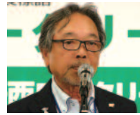
出席報告／ 福田出席委員

会員107名中68名出席。 出席率70・10%。前々回7月 19日の出席率64・21%を72 ・63%に修正します。