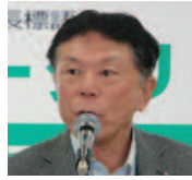
出席報告 / 淵上出席委員

会員109名中74名出席。 出席率74・75%。前々回7月 26日の出席率72・63%を84 ・21%に修正します。