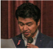
出席報告 橋本出席委員長

会員109名中74名出席。 出席率74%。前々回8月9日の出席率70・10%を81・44%に修正します。