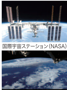
国際宇宙ステーション

まいました。今は月に行くとい うことはありませんが、国際宇 宙ステーション（ISS）という のがあります。こちらで常時3 〜6人の宇宙飛行士が今も生 活しています。日本からも何人 か滞在しています。だいたい半年 ぐらいで交代していきますが、ほ ぼ毎年行く予定になっています。今 年も年末には日本人宇宙飛行 士が行きます。地球から高度約 400kmぐら이를飛んでいて宇 宙ステーションから地球をみると 左の写真のようになります。