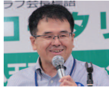
Space PLAN-K 代表 國方 則和 氏

「宇宙」と聞いて皆さんどうい うものを思い浮かべますか？小 学生に聞くと、ほし、ちきゅう、 たいよう、つき、とおい、UFO、 うちゅうじん、ブラックホール、い んせき、ながれぼし、むじゅう りよく、ウルトラマンR/B、ガン ダム、NASA、うちゅうひこうし …などが出てきます。これを整 理すると、SFであったり、天文 であったり宇宙開発であったり 宇宙ビジネスに別けられます。