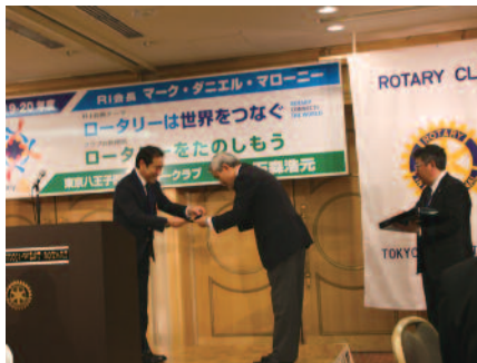
塚本R財団・米山委員長より