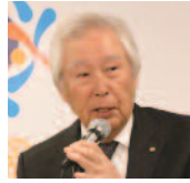
出席報告 檜崎出席副委員長

会員110名中71名出席。 出席率72・45%。前々回10月9日の出席率55・10%を83・67%修正します。