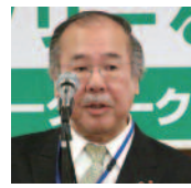
出席報告／山田出席委員