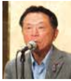
出席報告／ 測上出席委員長