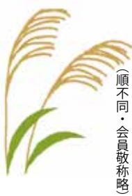
（順不同・会員敬称略）