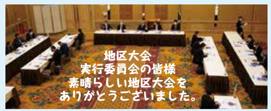
地区大会 実行委員会の皆様 素晴らしい地区大会をありがとうございました。