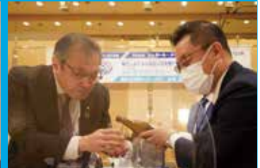
1971年4月9日生まれ 2022年8月入会 株式会社多摩ニッタンサービス 代表取締役 親睦・家族委員会 委員