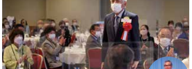
2021-22 年度 国際ロータリー会長代理 辰野克彦様