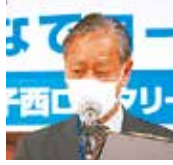
出席報告 松島出席委員