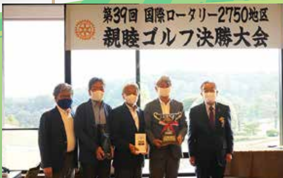
優勝：東京芝ロータリークラブ