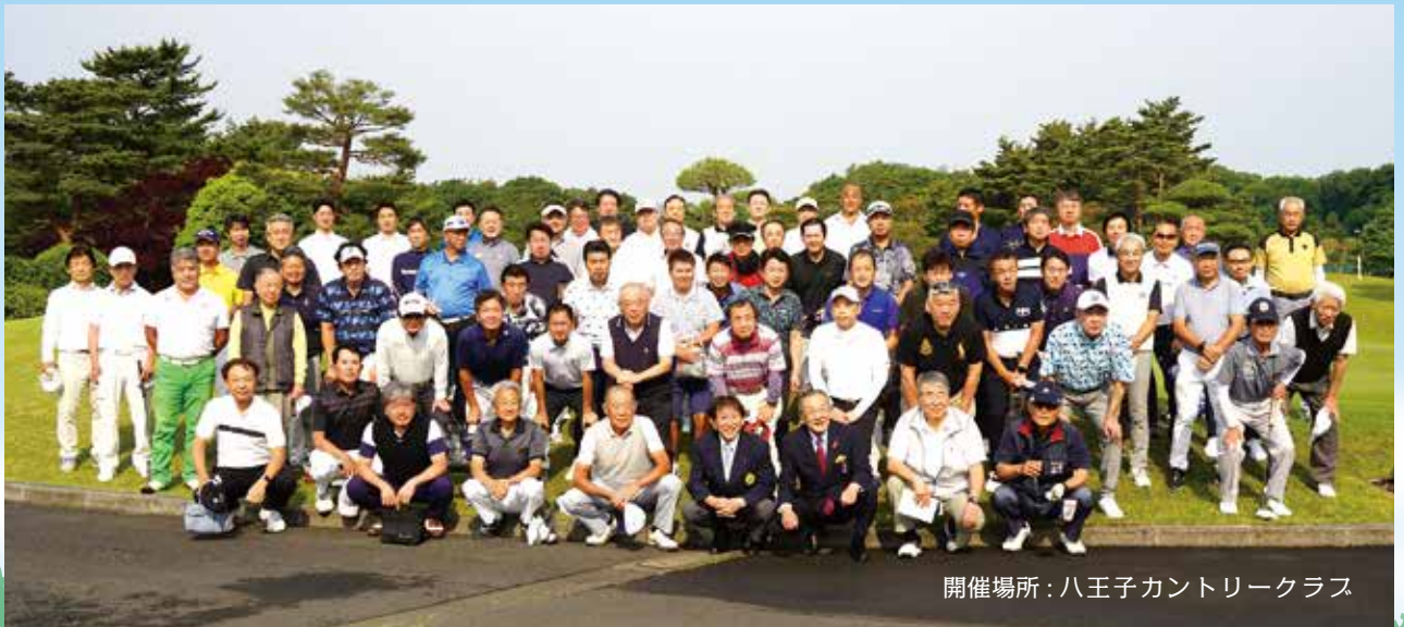
開催場所：八王子カントリークラス