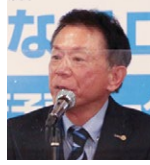
出席報告 洲上出席副委員長