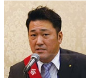
司会 長尾会場監督補佐