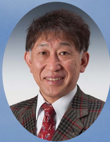
東京八王子西ロータリークラブ