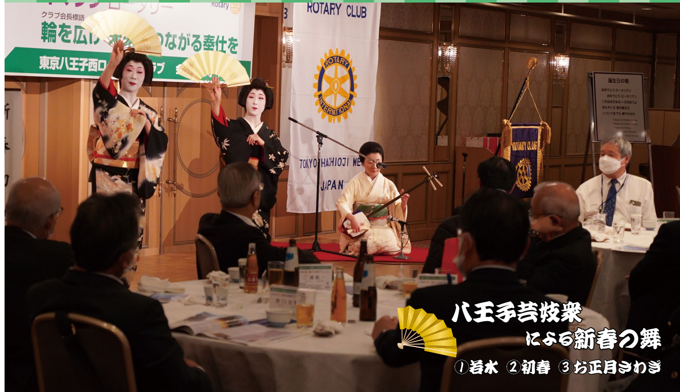
八王手芸技衆 にふる新春の舞 ①若水 ②初春 ③お正月さわぎ