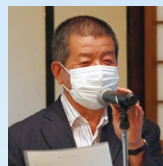
岡本出席委員長 出席報告

会員100名中51名出席。 出席率54.13%。前々回7月29日の出席率68.82%を79.57%に修正します。