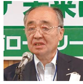
二二三〇発表／ 西川財務委員