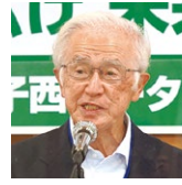
出席報告／ 宮澤出席委員