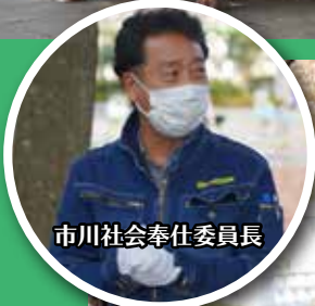
市川社会奉仕委員長