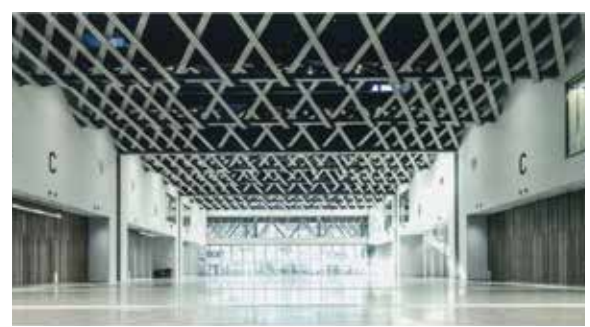
東京たま未来メッセ 1階 Exhibition Hall

先ほどご紹介いただきました通り、私は2015年の4月から2016年の10月までの1年7か月、2016年のオリンピック・パラリンピックの業務に携わりました。その後、東京都のオリンピック・パラリンピック準備局の配属となり、大会のアクセシビリティに関する業務を担当し、大会を迎えました。 大会は、昨年の7月23日からオリンピック、8月24日からパラリンピックが実施されました。実施種目は、オリンピックは全33競技、パラリンピックは全22競技で熱戦が繰り広げられました。 東京大会を開催するにあたりまして、東京都は、東京アクアティクスセンター、有明アリーナ、海の森水上競技場、カヌー・スラロームセンター、大井ホッケー競技場、夢の島