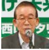
出席報告 坂下出席委員

会員105名中69名出席。出席率70・40%。前回10月28日の出席率75・00%を84・38%に修正します。