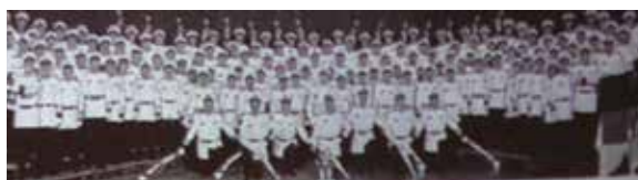
ニュートラディション

やっぱりこ ういう古き 良き時代の 人たちがシ カゴには多 いようです。 バーバー ショップと いうのは、要 するに床屋 のことです ね。なんで床 屋かという と、男どもは 用もないの に床屋に集 まってわい わい、ガヤガヤ遊んでた時代 があったんです。今から1 00年から120年ぐらゐ前 です。