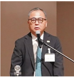
武藤英正ガバナーエレクト