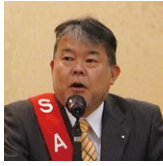
司会 / 秋間会場監督補佐