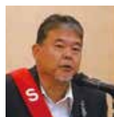
司会／ 秋間会場監督補佐