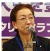
出席報告／ 神保出席委員長